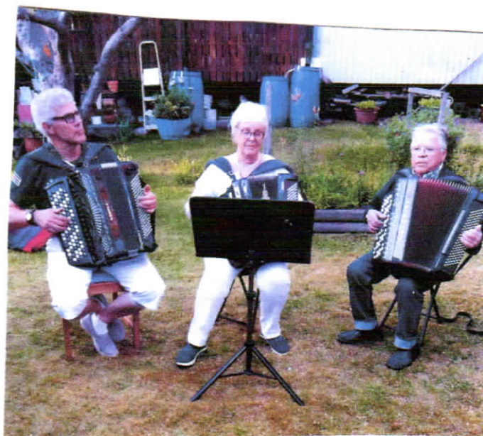
BILD FRÅN MIDSOMMARAFTONS- KVALLEN,